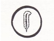
Figure de la plume avec laquelle on signe de son sang un pacte satanique : le signataire est « enfermé » et « protégé » à l'intérieur du « cercle magique ».